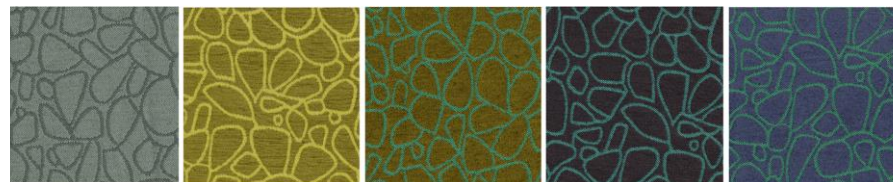
KIVIKKO 10 / 006