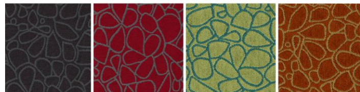
KIVIKKO 10 / 013