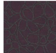
SAMMAL 110 / 107