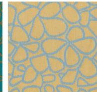
SAMMAL 110 / 111