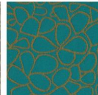
SAMMAL 110 / 110