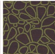
SAMMAL 110 / 109