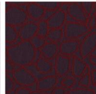
SAMMAL 110 / 108