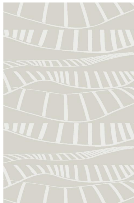
NCS 0603-G80Y _ 213