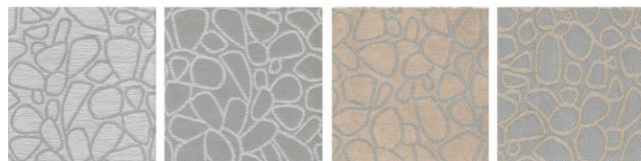
KIVIKKO 10 / 002

KIVIKKO on suunniteltu ja valmistettu Suomessa.