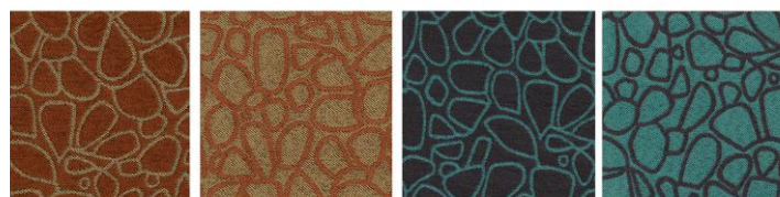
KIVIKKO 10 / 024