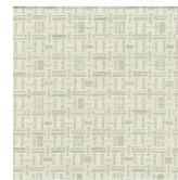
MEMO 130 EN 101

IMO FTFC Part 9 SFS-EN ISO 12947-2 EN ISO 105-B02(1999) + AM(2002) SFS-EN ISO 105-X12