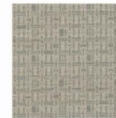
MEMO 130 EN 119