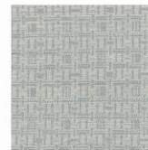
MEMO 130 EN 118