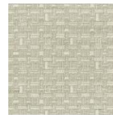
MEMO 130 EN 101b