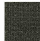
MEMO 130 EN 121b