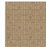
MEMO 130 EN 120