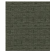
MEMO 130 EN 121