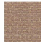
MEMO 130 EN 120b