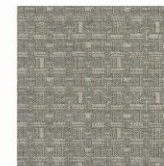
MEMO 130 EN 119b