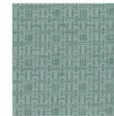
MEMO 130 EN 122