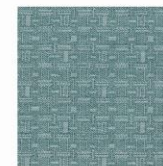
MEMO 130 EN 122b

EIJA NEVALA DESIGN INTERIOR • DESIGN • FABRICS