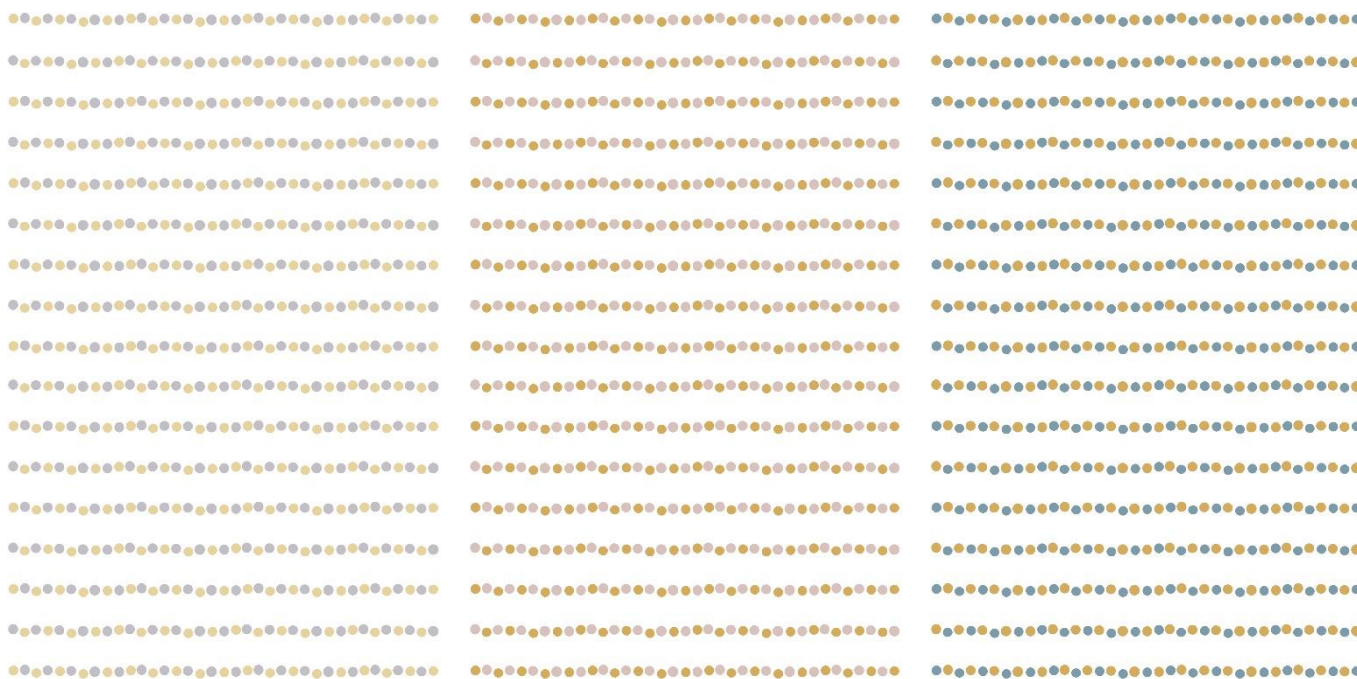
NCS 2005-R60B + 1020-Y10R

The design can be printed with individually chosen colors, by utilizing for example Pantone-, NCS- or Tikkurila Symphony color charts. To ease and to guide the color design, we have composed a few standard color combinations. Standard print colors are chosen and named by Tikkurila Symphony color chart codes.